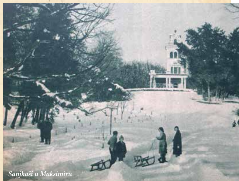
Sanjkaši u Maksimiru