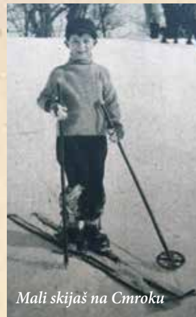
Mali skijaš na Cmroku