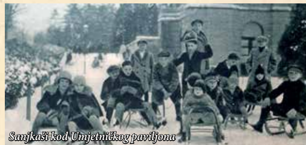
Sanjkaši kod Umjetničkog paviljona

O hirovitosti zagrebačkih zima i neizvjesnosti za gradske sanjkaše i skijaše doznajemo iz novinskog napisa objavljenog u veljači 1934: