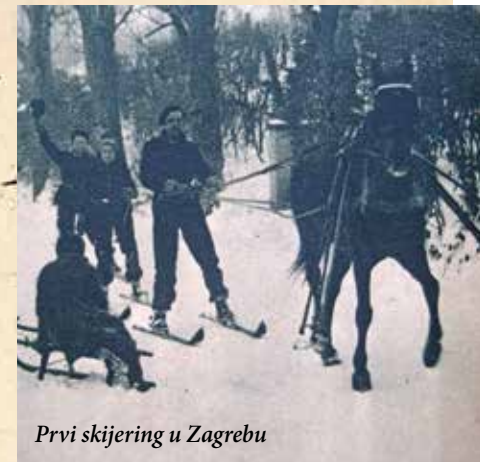
Prvi skijering u Zagrebu